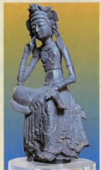
①銅造菩薩半跏像（国指定文化財）

昔、この地には千坪の滝があり、その渓流が広口に向かっていった。この滝によって「滝」地名が発祥した。但し、千坪の滝は昔の災害により現在は無い。滝内には如意山極楽寺の金剛弥勒菩薩半跏像（飛鳥時代、木造二臂如意輪観音半跏像の胎内仏像）、北辰妙見神社と古鐘、滝の大般若経、等有名な文化財がある。