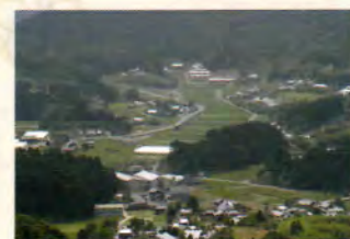
高野参詣の表参道町石道にあるニツ鳥居より天野を望む(当神社から山道徒歩30分)

丹生都比売神社の鎮まる地区「天野」は、随筆家白洲正子の著書「かくれ里」で高天原に例えられた穏やかな山里。史跡も多く、散策が楽しめます。