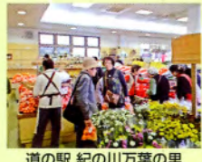
道の駅 紀の川万葉の里 ☎0736-22-0055