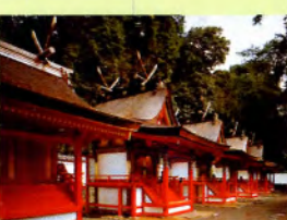
宝来山神社 本殿 (重要文化財)