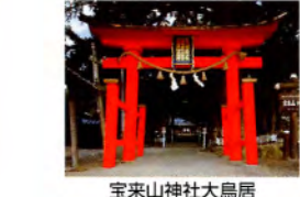
宝来山神社大鳥居